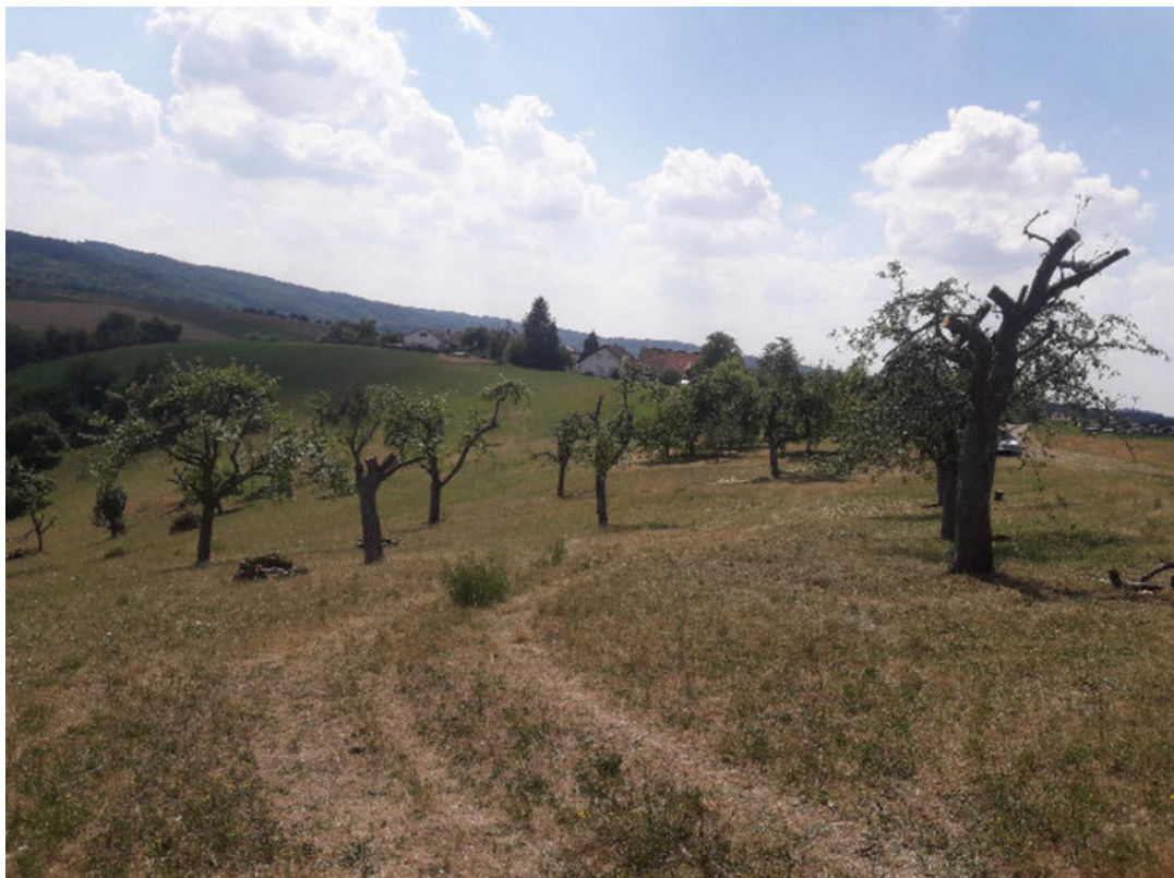
Abbildung: Nach dem Ökopunkteprojekt: Die Bäume sind geschnitten und von Misteln befreit.