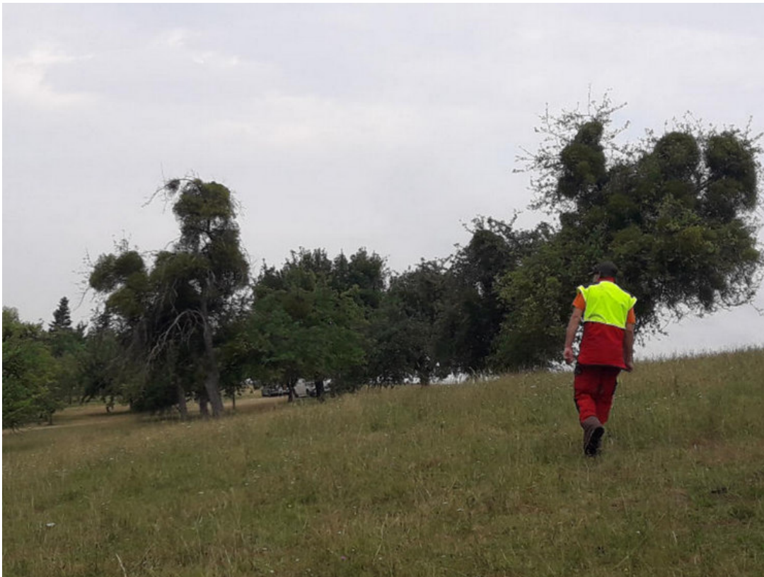
Abbildung: Vor dem Ökopunkteprojekt: Die Mistel hat die Streuobstbäume extrem befallen.

VORGEHEN: Alle Maßnahmen wurden im Vorfeld mit dem Besitzer der Flächen, der Unteren Naturschutzbehörde und dem Beweider in mehreren Begehungen abgesprochen und festgelegt. Ein Ingenieurbüro übernahm die Planung der Maßnahmen. Nach einem abschließenden Abstimmungsgespräch mit dem Besitzer der Flächen wurden alle vorgeschlagenen Maßnahmen festgelegt, die Ökopunkte berechnet und der Erläuterungsbericht sowie die dazugehörigen Übersichtskarten fertiggestellt. Die Unterlagen wurden bei der LUBW eingereicht, und ein naturschutzfachliches Ökokonto eröffnet. Das Konto betreut das Ingenieurbüro. Dieses führte nach der endgültigen Genehmigung der Unterlagen auch die Maßnahmen aus.